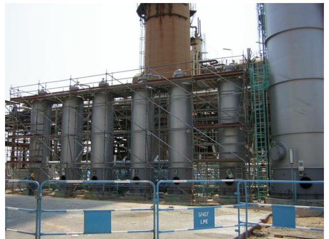
ECHAFAUDAGE DE SILOS