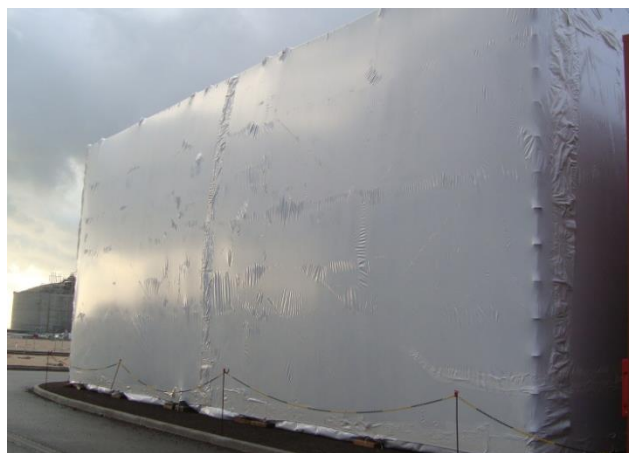
ECHAFAUDAGE - CONFINEMENT THERMO-RETRACTABLE