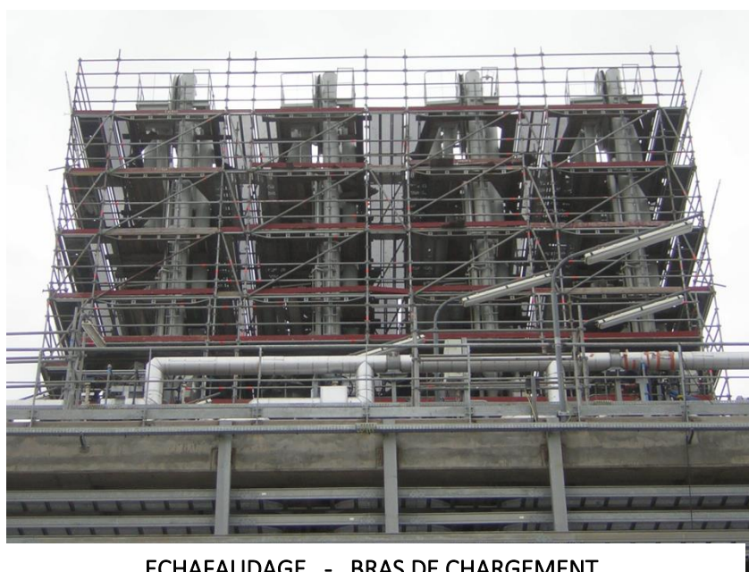
ECHAFAUDAGE - BRAS DE CHARGEMENT