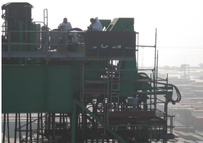
ECHAFAUDAGE SUSPENDU + 40 M - PORTIQUE PAM