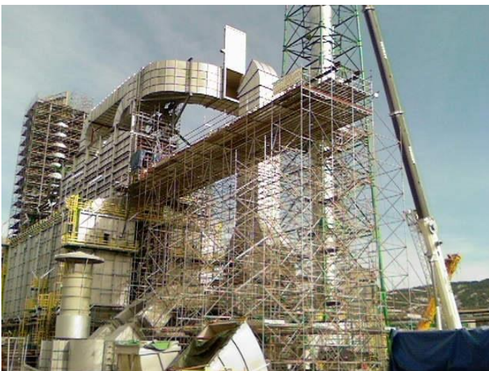
SORTIE DE FOUR