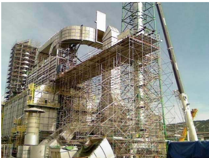
SORTIE DE FOUR