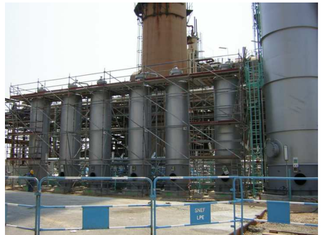
ECHAFAUDAGE DE SILOS