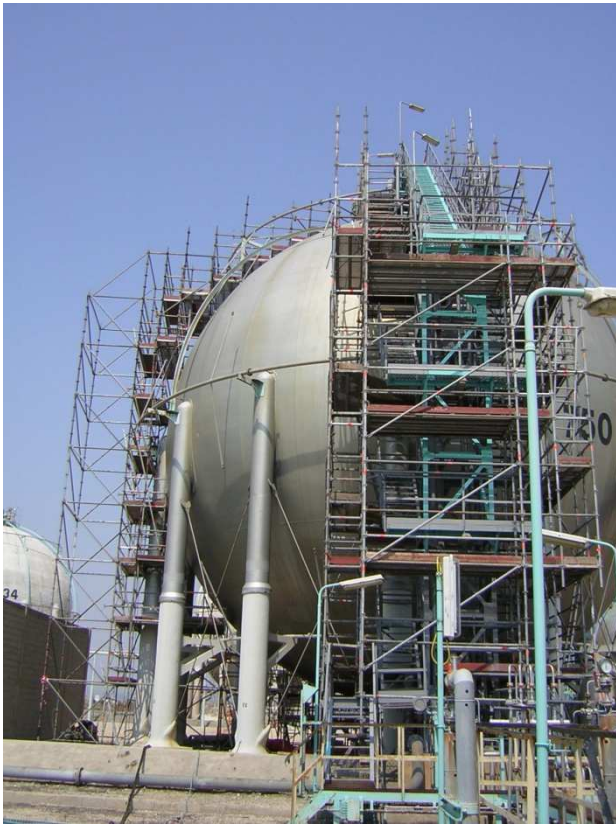
SPHERE TERMINAL GAZIER