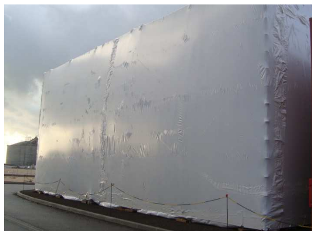
ECHAFAUDAGE - CONFINEMENT THERMO-RETRACTABLE