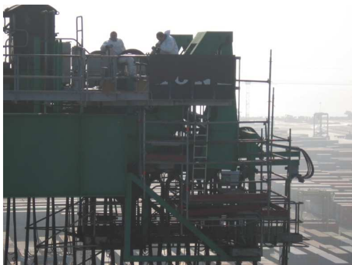
ECHAFAUDAGE SUSPENDU + 40 M - PORTIQUE PAM