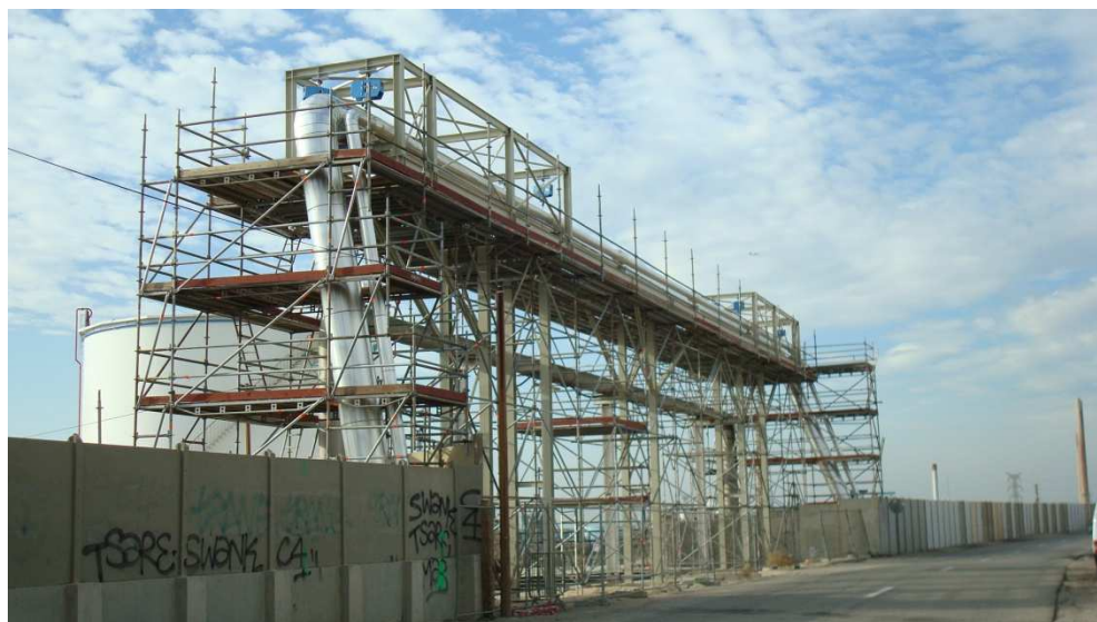
ECHAFAUDAGE/CALORIFUGE - RESEAU LIGNE VAPEUR