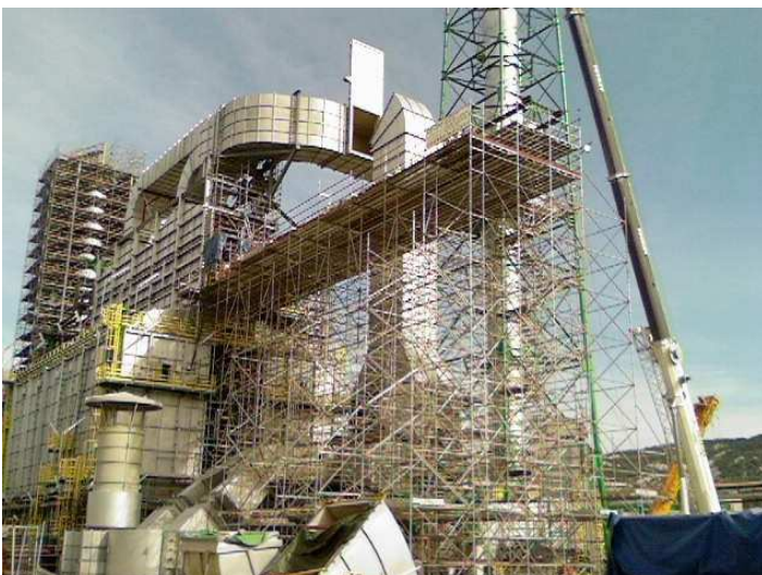
SORTIE DE FOUR