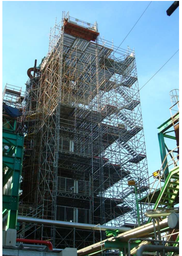
ECHAFAUDAGE DE COLONNE PLATELAGE ASCENSEUR MONTE-CHARGE