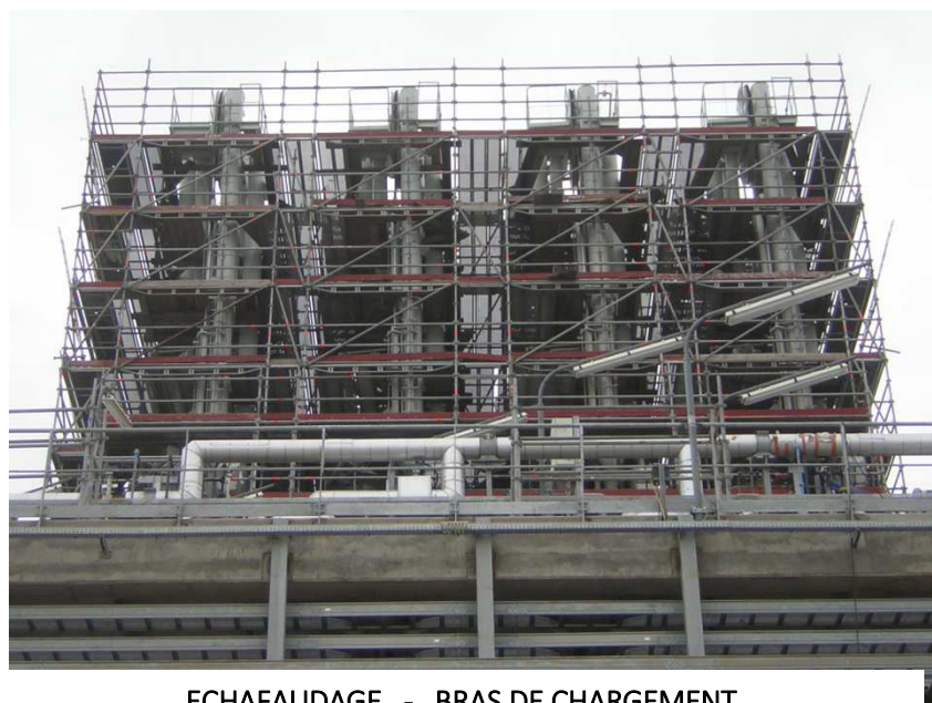
ECHAFAUDAGE - BRAS DE CHARGEMENT